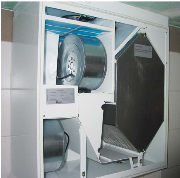
Obr. 6 O kvalitní vnitřní prostředí a neustálý přísun čerstvého vzduchu se stará větrací jednotka. Díky vysoce účinnému rekuperačnímu výměníku je vzduch ohříván na teplotu blízkou pokojové i v nejteplejších mrazech. Dohřát je pak potřeba jen zbylých pár stupňů.

Aby fungoval systém perfektně, je nutné jej správně navrhnout a provést. Vhodné je rozdělení budovy na tři zóny – přívod vzduchu (obytné místnosti), transport vzduchu (chodby, schodiště) a odtaž odpadního vzduchu (koupelna, WC, kuchyň). Rozvody by měly být co nejpřímější a nejkratší s ohledem na tlakové ztráty i možnost případného čištění. Větrací rozvody lze za určitých okolností použít i pro tzv. teplovzdušné vytápění, tj. vytápění pomocí ohřátého vzduchu. Pasivní dům má totiž tak nízké ztráty, že je lze pokrýt i ohřátým vzduchem.