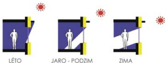
Obr. 4 Ochrana proti přehřívání interiéru v létě zabezpečuje stínění. Nejjednodušší je zvětšený přesah střechy – horizontální stínění. Další možností jsou nastavitelné venkovní žaluzie.

Okna v pasivním domě slouží takřka jako sluneční kolektor. Pasivní solární zisky tvoří významný příspěvek k pokrytí potřeby tepla na vytápění, až více než třetinový. Proto je důležitá vhodná orientace, velikost a kvalita prosklení. Ideální je jižní případně jihovýchodní či jihozápadní orientace hlavní prosklené plochy, v ostatních fasádách by pak mělo být oken co nejméně. Častou otázkou je vhodná plocha zasklení. Úspory energie díky solárním ziskům okny rostou přibližně do 30–40 % prosklené plochy v jižní fasádě. Další zvětšování oken již nevede k významným úsporám, spíš naopak, a navíc kvůli přebytkům slunečního tepla dochází k výraznému přehřívání interiéru. K dosažení potřebného letního komfortu je u velkých prosklených ploch zapotřebí zvolit vhodné stínění, například horizontálními přesahy (obr. 4) nebo venkovními žaluziemi, které jsou samozřejmě finančně náročnější.