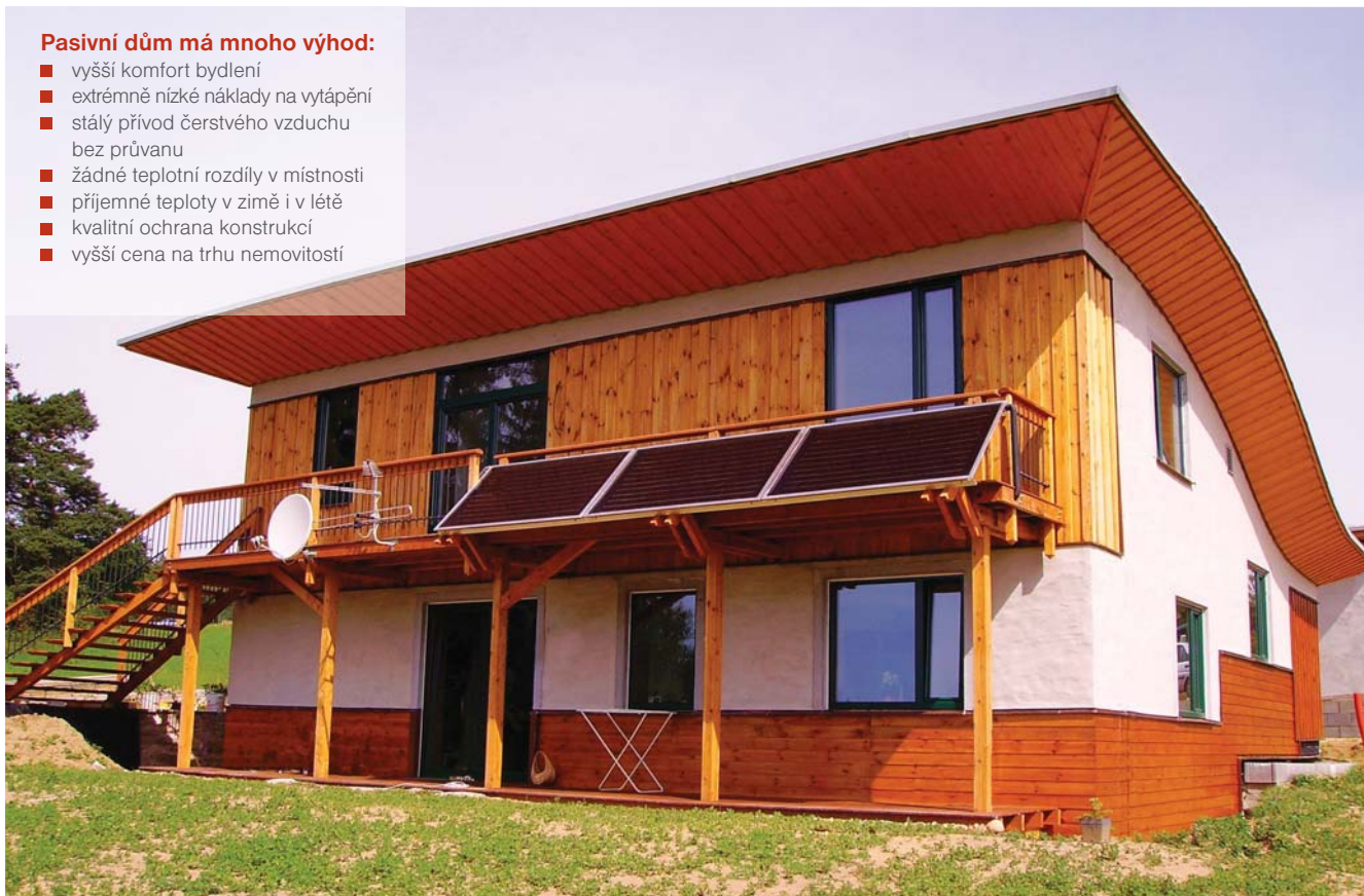
Obr. 1 Větší prosklení, tvar krychle, rovná střecha – to je nejčastější vzhled pasivních domů. Architektura je zde ovlivněna tvarovou kompaktností a jednoduchostí řešených detailů. Není to ovšem pravidlem. Pasivní domy lze stavět i tak, že jsou od běžných domů k nerozeznání. Autor návrhu, fotografie: Aleš Brotánek