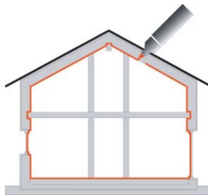
Obr. 5 Neprůvzdušnost zajišťuje spojitá vzduchotěsnicí vrstva, která musí být precizně vyhotovena. Kromě tepelných ztrát tato vrstva chrání konstrukce před vlivem vlhkosti, která se šíří přes netěsnosti.

Jednou z podmínek pasivního domu je vysoká míra těsnosti obálky. Není potřeba se bát, že dům nebude „dýchat“. Dům nemá dýchat přes konstrukce, potřebnou výměnu vzduchu má zabezpečovat dostatečné větrání. Malými otvory a netěsnostmi v obálce budovy uniká teplo současně s vlhkostí a vzniká nebezpečí, že vnitřní vlhkost bude kondenzovat uvnitř konstrukce a může ji poškodit. Netěsnost obálky současně ovlivňuje i efektivitu zpětného zisku tepla větracího systému, protože se vzduch vyměňuje netěsnostmi místo toho, aby procházel rekuperačním výměníkem. Proto už ve fázi projektování je nezbytné navrhnout v celém objektu spojitou vzduchotěsnou obálku bez zbytečného přerušení. Při realizaci je zase důležitá detailní stavební dokumentace a důkladný stavební dozor.